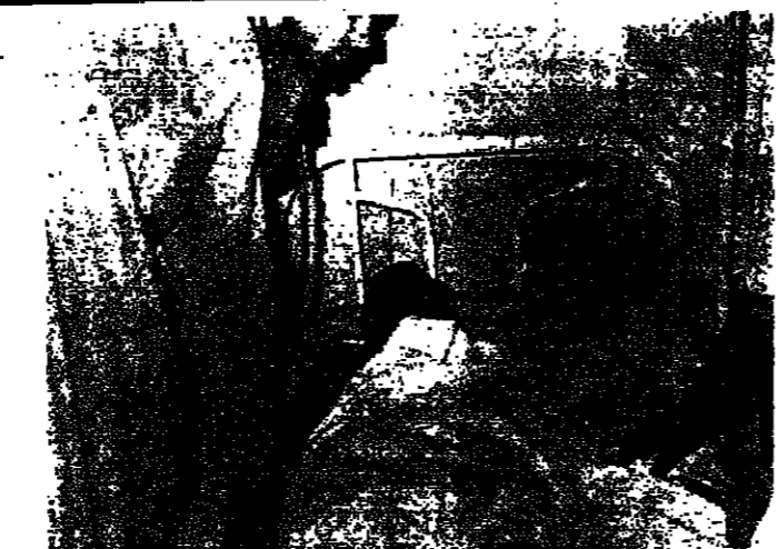
في الصور اعلاه بعض الجرحى لدى محتلتهم